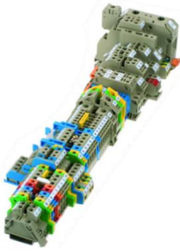
Schraub-Anschluss-System RK Zugbügel-Prinzip