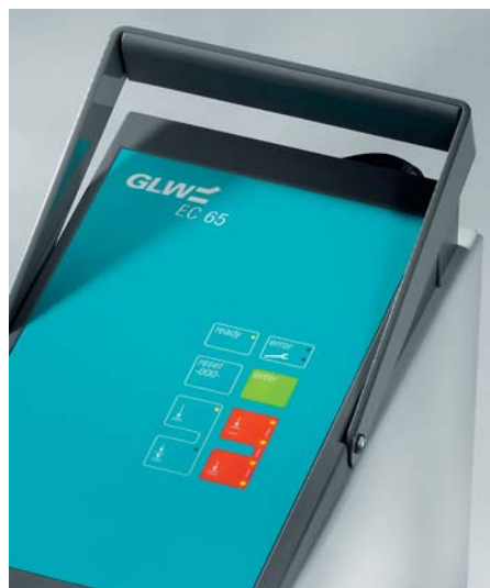
Der Tragegriff macht den EC 65 mobil. A handle makes the EC 65 portable.