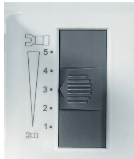
Der Presskraftbeginn ist einstellbar. The beginning of the press capacity is adjustable.